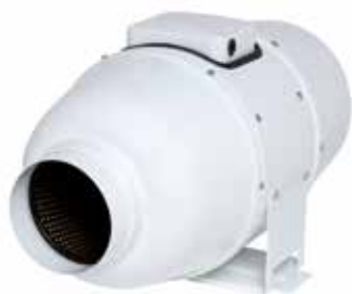
IN LINE XSilent

IN LINE XSilent est un ventilateur de conduit performant et silencieux grâce à son enveloppe acier et son isolation intérieure de 50 mm.