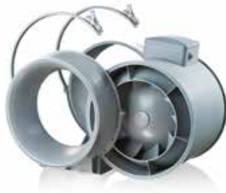
Bloc moteur démontable