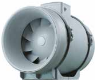
IN LINE XPro

IN LINE XPro est un ventilateur de conduit performant et économe en énergie. Son bloc moteur démontable facilite le montage et la maintenance.