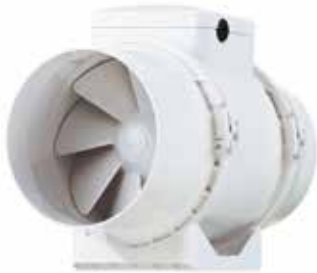
IN LINE XS

IN LINE XS est un ventilateur de conduit compact pour une ou plusieurs pièces. Son bloc moteur démontable facilite le montage et la maintenance.