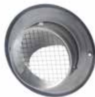
Grille façade IR 304