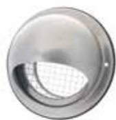
Grille façade IR 304

La grille extérieure circulaire murale IR304 permet la prise d'air ou le rejet d'air vicié sans risque d'entrée de pluie ou d'insectes.