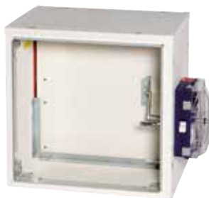
ISONE 1500 à Manchettes

ISONE 1500 à Manchettes fait partie d'une gamme de clapets coupe-feu encastrés, validée jusqu'à EI240S et 1500 Pa et optimisée pour les IGH.