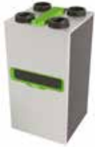
InspirAIR® Top 300 Classic

La solution double flux qui filtre efficacement les polluants les plus fins et s'adapte à vos besoins