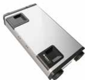
InspirAIR® Home SC 150 Classic Droite

Solution de ventilation double flux qui bat au rythme de la vie des occupants.