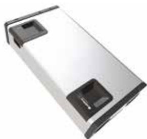
InspirAIR® Home SC 370 Classic Droite

Solution de ventilation double flux qui bat au rythme de la vie des occupants.