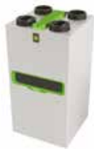
InspirAIR® Top 300 Premium ERV

La solution double flux connectée qui filtre efficacement les polluants les plus fins et s'adapte à vos besoins