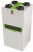
InspirAIR® Top 450 Premium

La solution double flux connectée qui filtre efficacement les polluants les plus fins et s'adapte à vos besoins