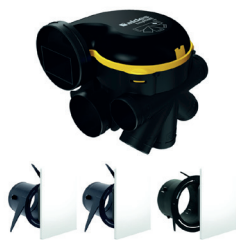
Kit Auto DHU + 3 grilles design ColorLINE®

EasyHOME AUTO DHU : la VMC autonome qui détecte et régule l'humidité partout dans le logement pour un confort sain et silencieux.