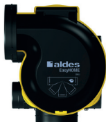
Groupe Auto DHU