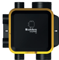
Groupe Auto DHU Compact