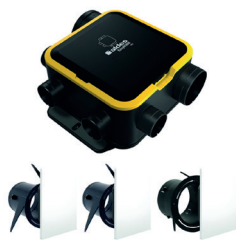
Kit Auto DHU Compact + 3 grilles ColorLINE®

EasyHOME AUTO DHU COMPACT : la VMC autonome qui détecte et régule l'humidité partout dans le logement pour un confort sain et silencieux.