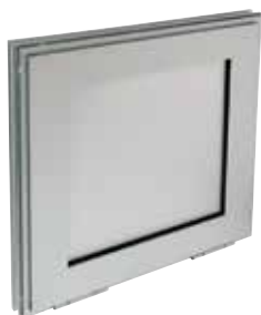
OXYTONE PANNEAU 2012 fermé, en position attente

L'amenée d'air OXYTONE Panneau 2012 assure l'apport d'air neuf en cas d'incendie, avec une esthétique optimale et une isolation thermique optimum.