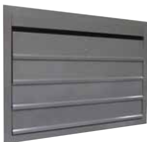
OXYTONE LAMES 2013 fermé en position attente

L'amenée d'air OXYTONE Lames 2013 assure l'apport d'air neuf en cas d'incendie et son réarmement motorisable en facilite la maintenance.