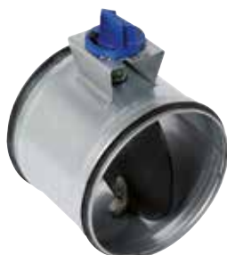
RGE à joint manuel et motorisable

Le registre RGE équilibre et isole manuellement ou avec un moteur un réseau circulaire tout en garantissant un très faible taux de fuite.