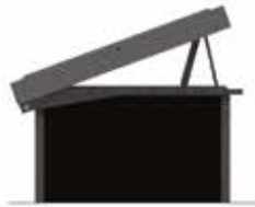
SOS VELONE Kit Souche Terrasse