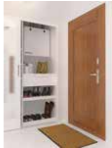
Mise en situation InspirAIR® Top 210