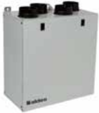
InspirAIR® Top 210

La VMC double flux la plus compacte du marché