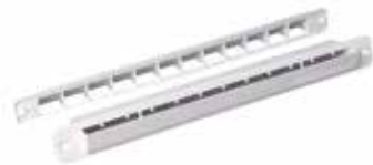
Entrée d'air module encastré - Blanc

Module est une entrée d'air autoréglable pour menuiserie avec un minimum d'encombrement.