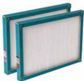
Kit filtres InspirAIR Top 210

La VMC double flux la plus compacte du marché