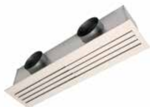
LINED COMBINED TP OUVRANT

Le LINED® Combined est un diffuseur linéaire en aluminium à fentes réglable pour la diffusion et la reprise d'air combinées pour bâtiments tertiaires.