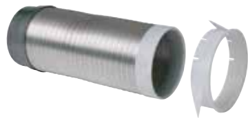
Liaison RT Flex 30-120 cm

La RT Flex permet de réaliser un raccordement terminal (colonne / bouche) étanche et durable en réseau collectif ou tertiaire.