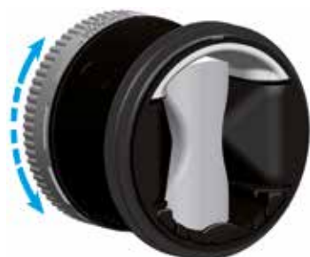
MR Modulo VMT