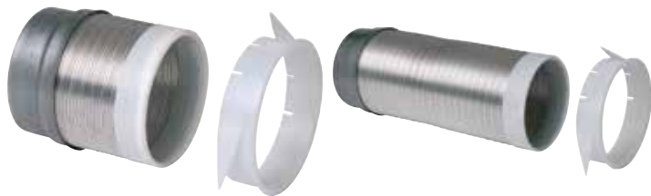
Liaison RT Flex 10-30 cm

La RT Flex permet de réaliser un raccordement terminal (colonne / bouche) étanche et durable en réseau collectif ou tertiaire.