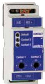
Module Contact Mod

Le Module Contact Mod permet au système VMT de recevoir des informations d'autres éléments pour optimiser le fonctionnement de tous les systèmes.