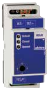
Module Relay Mod

Le Module Relay Mod permet au système VMT d'envoyer des informations vers d'autres éléments pour optimiser le fonctionnement de tous les systèmes.