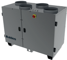
DFE R TOP

La centrale double flux compacte rotative à flux verticaux la plus accessible du marché