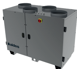
DFE R TOP

La centrale double flux compacte rotative à flux verticaux la plus accessible du marché