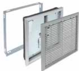
OPTONE «classic» 2H/2V

Les volets de désenfumage OPTONE «Classic» sont destinés aux locaux tertiaires et peuvent être utilisés en amenée d'air comme en extraction de fumées.