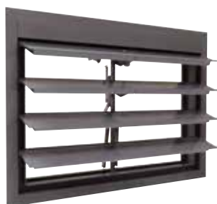
OXYTONE LAMES 2013 ouvert en position de sécurité