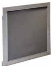
Fermé, en position attente

L'amenée d'air AIRONE assure l'apport d'air neuf en cas d'incendie, avec une esthétique optimale et une bonne isolation thermique.