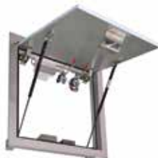
Ouvert, en position de sécurité