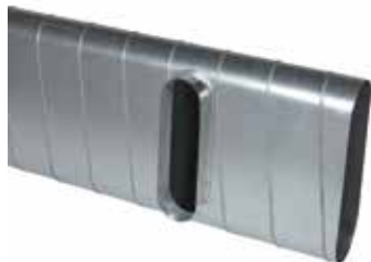
Piquage Droit Oblong sur Plat

Le piquage droit oblong sur plat 90° permet de réaliser un piquage à 90° sur un conduit de type oblong ou rectangulaire galvanisé.