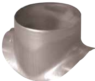
Piquage Equerre Circulaire en aluminium

Le piquage équerre circulaire alu permet de réaliser un piquage à 90° sur un conduit circulaire aluminium.