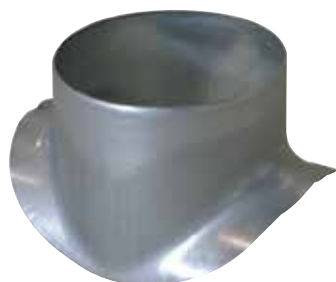
Piquage Équerre Circulaire 90°

Le piquage équerre circulaire permet de réaliser un piquage à 90° sur un conduit circulaire galvanisé.