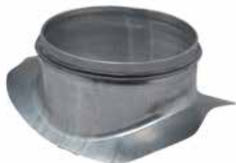
Piquage Equerre Circulaire à joints

Le piquage équerre circulaire à joints permet de réaliser un piquage à 90° sur un conduit circulaire galvanisé.