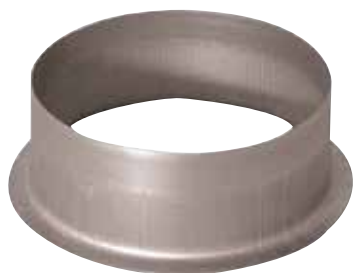
Piquage Equerre sur Plat en aluminium

Le piquage équerre sur plat alu permet de réaliser un piquage à 90° sur un conduit rectangulaire aluminium.