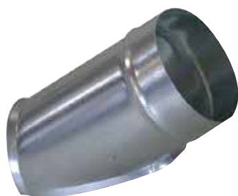
Piquage Oblique Circulaire 45°

Le piquage oblique circulaire permet de réaliser un piquage à 45° sur un conduit circulaire galvanisé.