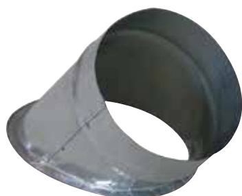
Piquage Oblique sur Plat 45°

Le piquage oblique sur plat permet de réaliser un piquage à 45° sur un conduit de type oblong ou rectangulaire galvanisé.