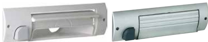
Plinthe ramasse-miette blanc - volet ouvert

La solution discrète pour évacuer les poussières d'une cuisine ou d'une entrée.