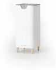
Alana sur pieds

Alana™, le purificateur d'air compact et efficace avec le coût d'utilisation le plus bas du marché.