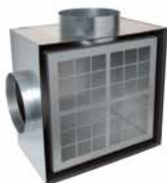
Double plénum R-RE