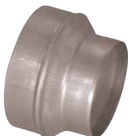
Réduction Conique Concentrique en aluminium

La RCC alu permet de raccorder deux conduits aluminium de diamètres différents entre eux.