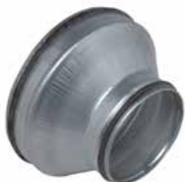
Réduction Conique Concentrique à joints

La RCC à joints permet de raccorder deux conduits galvanisés de diamètres différents entre eux tout en assurant une étanchéité classe C.