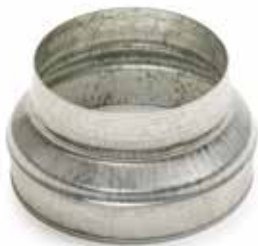
Réduction Conique Concentrique

La RCC permet de raccorder deux conduits galvanisés de diamètres différents entre eux.