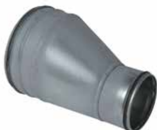
Réduction Conique Excentrée à joints

La RCE à joints permet de raccorder deux conduits galvanisés de diamètres différents entre eux tout en assurant une étanchéité classe C.