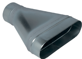
Réduction Concentrique Oblongue Cylindrique

La RCOC permet de raccorder un réseau oblong à un réseau circulaire.