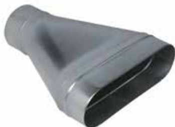
Réduction Concentrique Oblongue Cylindrique

La RCOC permet de raccorder un réseau oblong à un réseau circulaire.