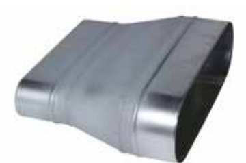
Réduction Concentrique Oblongue

La RCO permet de raccorder deux conduits oblongs de sections différentes.