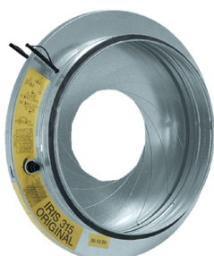
Registre à iris

Le registre à iris permet d'équilibrer finement un réseau circulaire tout en garantissant un très faible taux de fuite (étanchéité classe C).