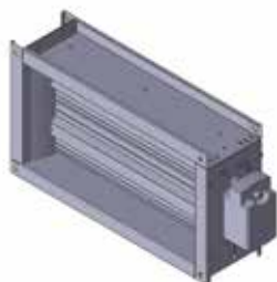
Registre motorisé pour VEX