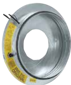
Registre à iris

Le registre à iris permet d'équilibrer finement un réseau circulaire tout en garantissant un très faible taux de fuite (étanchéité classe C).